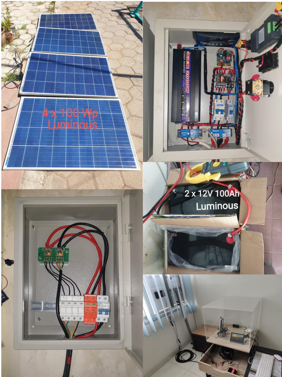
Gambar Perangkat Penelitian

Ada banyak paradigma untuk Fog Computing terkait dengan edge computing, termasuk komputasi tepi multi-akses (MEC), komputasi kabut, dan cloudlet, dan bagaimana mereka dapat bekerja sama dengan Cloud Computing dan Software-Defined Networking (SDN). Fog Computing dapat diartikan sebagai bentuk sistem komputasi, penyimpanan, jaringan, dan pengelolaan data pada node yang dekat dengan pengguna atau perangkat, yang tidak hanya diproses pada sistem cloud [Ref. 1]. Proses komputasi dan penyimpanan dapat dilakukan di ujung jaringan melalui pusat data mikro [Ref. 2]. Karena kedekatannya dengan pengguna atau perangkat, latensi edge computing bisa lebih rendah daripada langsung ke sistem cloud. Berdasarkan penelitian dari 1000 website