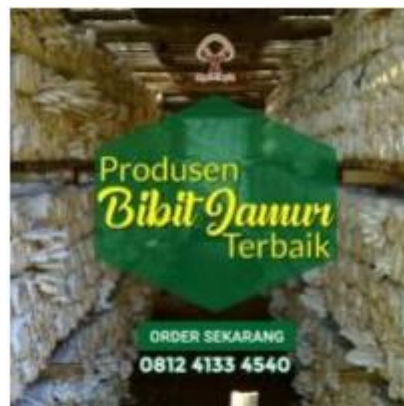
Gambar salah satu kumbung (tempat budidaya jamur) CV.Mycotopia

Penulis melakukan analisis kebutuhan dengan melakukan wawancara dengan pihak di salah satu industri kecil dan menengah yaitu CV.Mycotopia yang beralamat di kota Makassar (Ref. 16). CV.Mycotopia bergerak di bidang budidaya jamur tiram dan pengadaan alat budidaya jamur. Budidaya jamur tiram merupakan potensi bisnis yang sangat menjanjikan jika dikembangkan di daerah tropis seperti Indonesia.